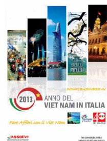
Tavola rotonda Milano 4 Aprile